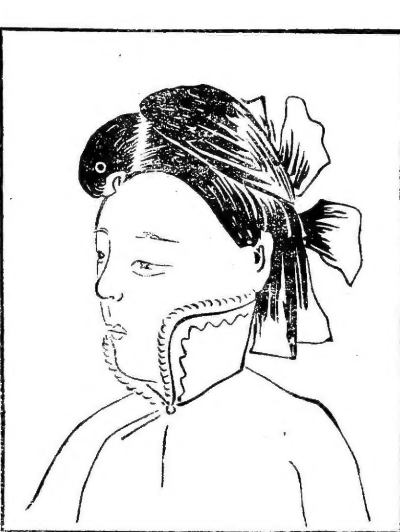
遠看美人之髮近看一鳥也(韻溜寫)